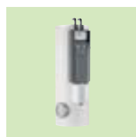
Inisol UNO 150 I έως 400 I