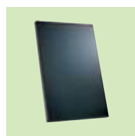
Συλλέκτης Inisol DB