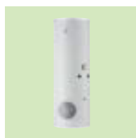
Inisol UNO BSL 200 έως 500 λίτρα

Για περισσότερες, πληροφορίες σκανάρετε το QR code: