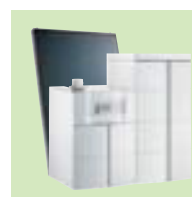
TWINEO EGC 17/29 ή 25 / B 200SSL