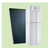
TWINEO EGC 17/29 ή 25 / V 200SSL