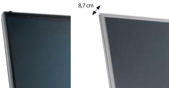
Inisol DB συλλέκτης